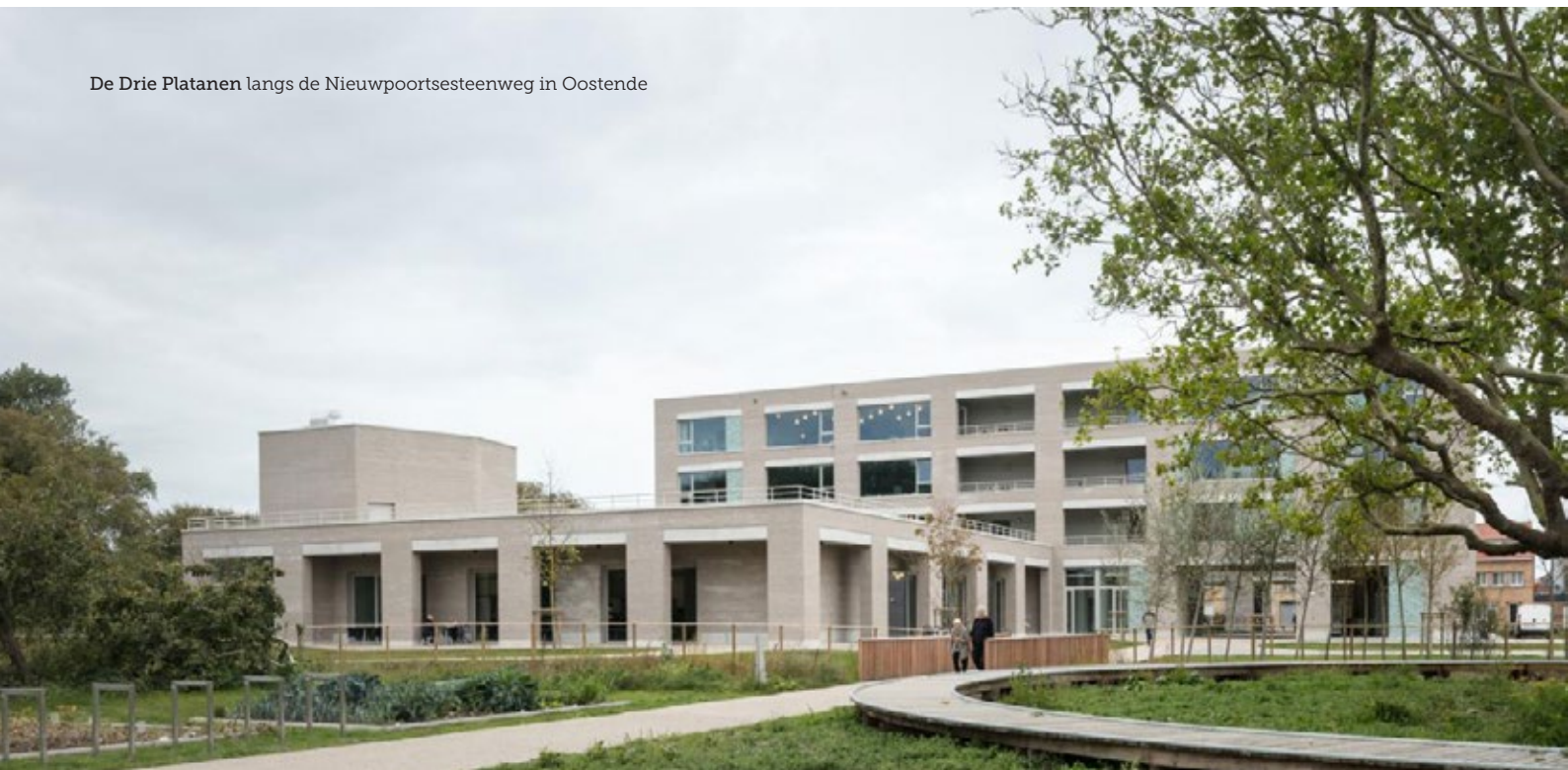
De Drie Platanen langs de Nieuwpoortsesteenweg in Oostende